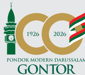
LOGO VERSI FLAT COLOUR