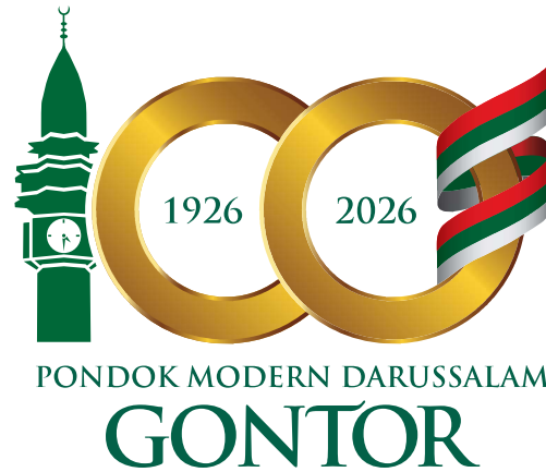
LOGO UTAMA (FULL COLOUR)

Panitia mengajukan desain logo hasil perbaikan kepada Pimpinan PMDG pada 14 Juni 2023.