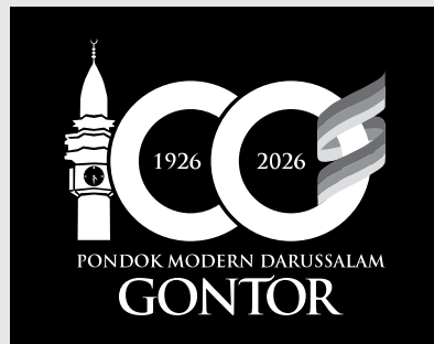
LOGO VERSI NEGATIVE BW