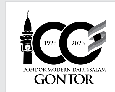
LOGO VERSI POSITIVE BW